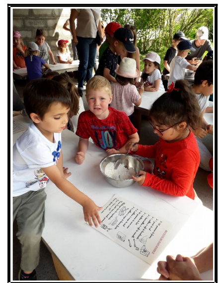
Notre sortie scolaire à l'abeille gourmande à St Nicolas de Macherin